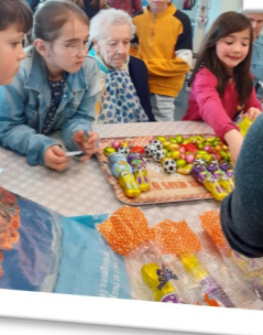
Chasse aux œufs avec les enfants du personnel