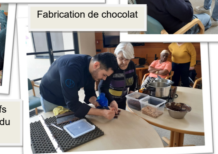
Fabrication de chocolat