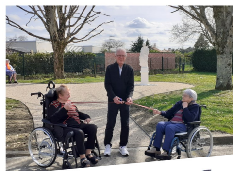
Repas et inauguration de la place Saint Joseph