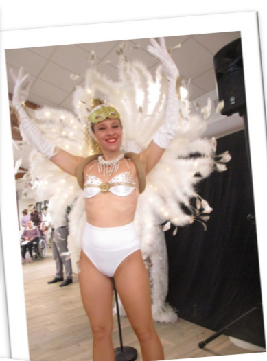
Fête de Noël