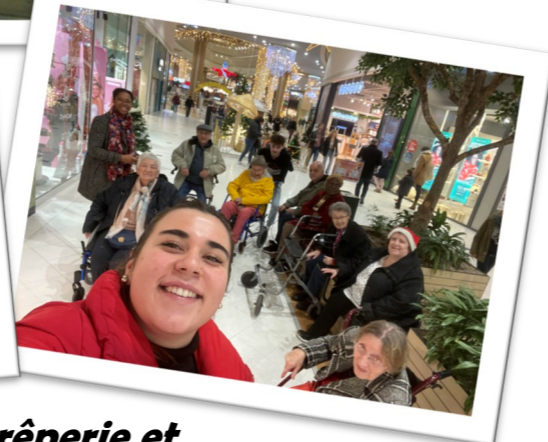
Sortie a la crêperie et balade dans les galeries marchandes