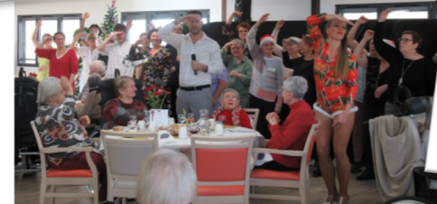
Goûter gaufres et vin chaud