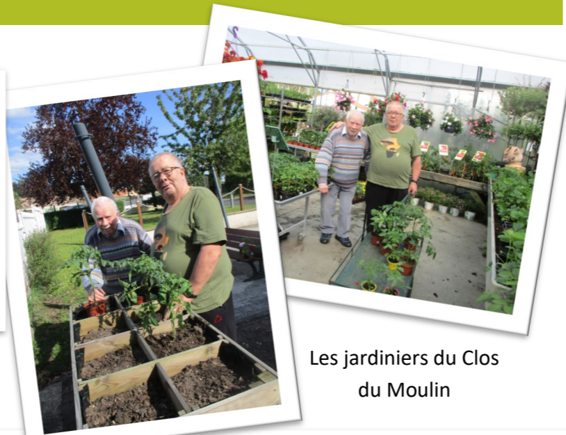
Les jardiniers du Clos du Moulin