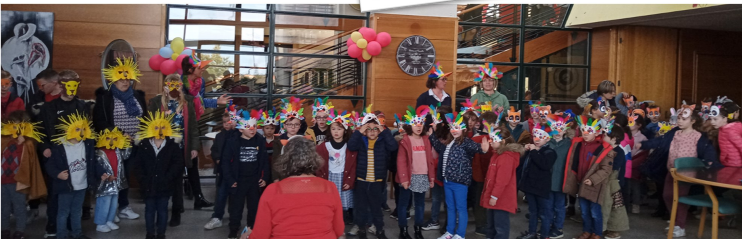
Le carnaval des écoles