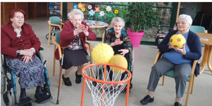
Activité jeux d'adresse