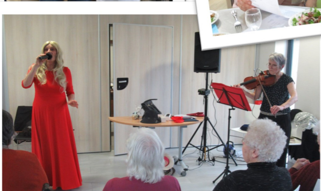
Spectacle « Les Blondes »