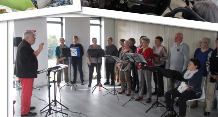
La chorale du Landreau